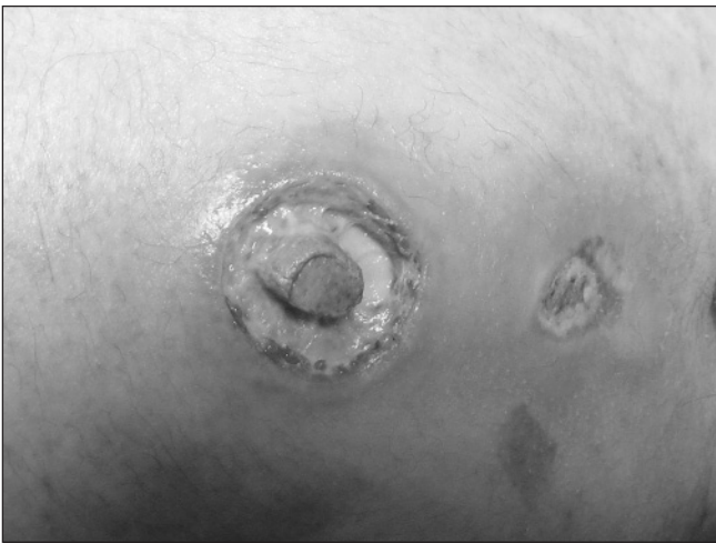
Fig. 3. UPP grado III, la úlcera afecta al tejido subcutáneo. Úlcera sobre prominencia vertebral en la espalda.

—Estadio IV: extensa destrucción tisular implicando al músculo, hueso o tendones (Fig. 4).