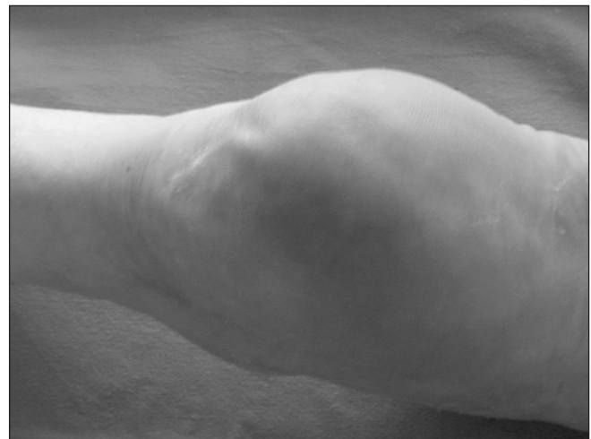
Fig. 1. UPP grado I: eritema violáceo que no blanquea a la presión. Úlcera en talón.

—Estadio III: pérdida del espesor completo de la piel que se extiende al tejido subcutáneo pero mantiene intacta la fascia (Fig. 3).