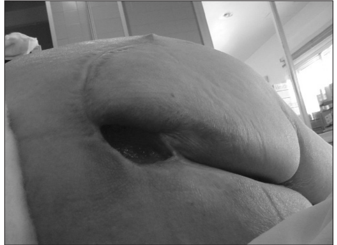
Fig. 4. UPP grado IV, la lesión afecta a tejidos en profundidad. Úlcera sacra.